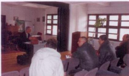
Советување за користење на средства од ИПАРД Програма 2007-2013 година

На ден 08.02.2010 година се одржа првото советување за занаетчии од руралните подрачја кои се можни корисници на ИПАРД програмата 2007-2013 согласно Упатството за корисници на средства од ИПАРД програмата 2007-2013 година. На првото советување беа повикани 20 занаетчии кои имаат регистрирано седиште за вршење занаетчиска дејност во руралните подрачја на град Скопје, согласно упатството во кое се наведени сите рурални подрачја од кои можат да аплицираат нашите членови занаетчии за користење на ИПАРД средства од мерката 302 во која влегуваат занаетчии кои се занимаваат со традиционални занаети во рурални средини. Во тек се и индивидуални разговори, припреми и изработка на деловен план за аплицирање во Агенцијата за финансиска поддршка во земјоделството и руралниот развој при Владата на Р. Македонија. Рокот за пријавување на првата група апликанти е продолжен до 17 март 2010 година.