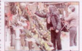
Повторно испи судбината на цвеќариите