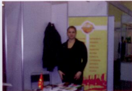
Хрватската премиерка Јадранка Косор на штандот на Занаетчиска комора Скопје на саемот VIROEXPO

На ден 08.02.2010 година се одржа првото советување за занаетчии од руралните подрачја кои се можни корисници на ИПАРД програмата 2007-2013 согласно Упатството за корисници на средства од ИПАРД програмата 2007-2013 година. На првото советување беа повикани 20 занаетчии кои имаат регистрирано седиште за вршење занаетчиска дејност во руралните подрачја на град Скопје, согласно упатството во кое се наведени сите рурални подрачја од кои можат да аплицираат нашите членови занаетчии за користење на ИПАРД средства од мерката 302 во која влегуваат занаетчии кои се занимаваат со традиционални занаети во рурални средини. Во тек се и индивидуални разговори, припреми и изработка на деловен план за аплицирање во Агенцијата за финансиска поддршка во земјоделството и руралниот развој при Владата на Р. Македонија. Рокот за пријавување на првата група апликанти е продолжен до 17 март 2010 година.