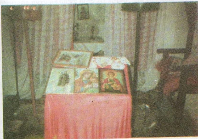
Ikonostasot od pomladata crkva