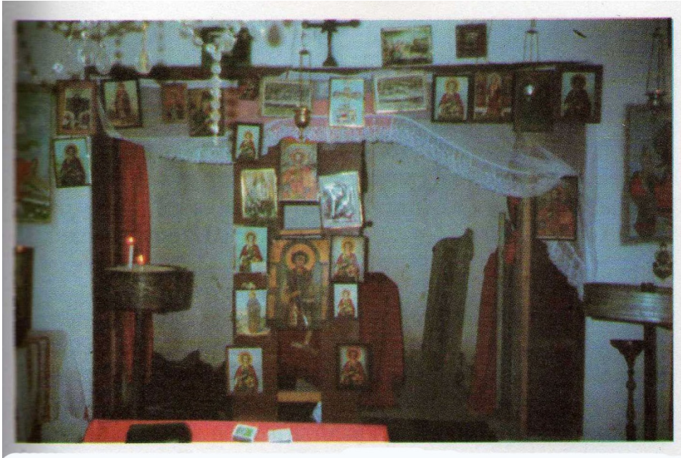
Vnatresnosta na pogolemata crkva

Po pretskazovanje na Karafila Gogova od s.Polciste,na nejjina inicijativa i sesrdno zalaganje 1985 godina,pocnata e i izgradena nova,mala crkva na starata lokacija,odnosno na izbranoto mesto.Vo izgradbata golem pridones dade i nejjinot soprug Milan.Vo momentot na pisuvanieto na ovie redovi i dvajcata ne se megu zivite.